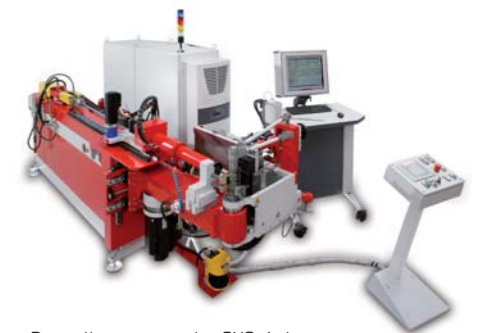
Die vollautomatische CNC-Anlage Typ DB 642-CNC

duktsparten über zwei Werke mit hoher Fertigungstiefe, in denen Produktlösungen für individuelle Anwendung