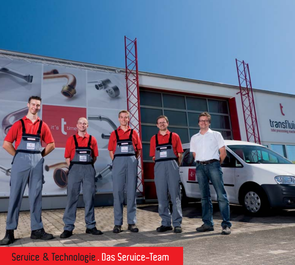
Service & Technologie . Das Service-Team