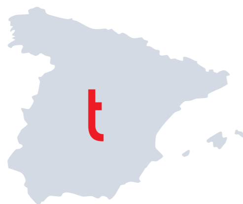
time(s) check . Spanien