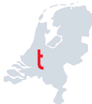
time(s) check . Niederlande